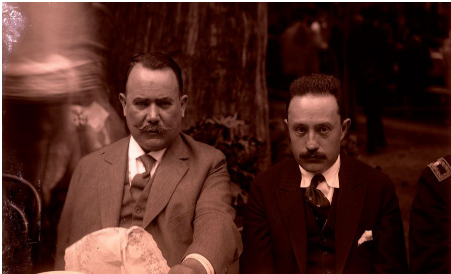
Álvaro Obregón y José Vasconcelos.