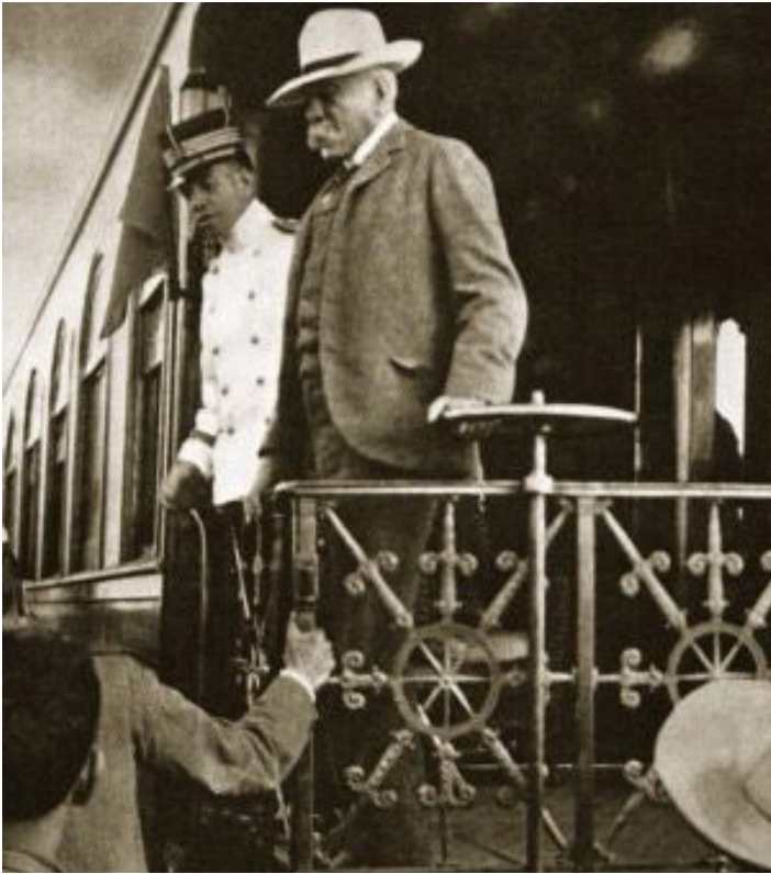
Porfirio Díaz.

pidiera al Presidente Díaz, la línea del ferrocarril pero en conexión con Tuxtla Gutiérrez. Y aunque el Presidente sí veía la necesidad e importancia de la construcción de un ferrocarril para Chiapas, finalmente se decidió por la construcción en la zona costa. Aunque es posible que esto también se debiera a que Guatemala se encontraba en la construcción del ferrocarril que conectaría con los pueblos más cercanos al Soconusco y, el Díaz era consciente de la falta de inversión que se había hecho en esta región.