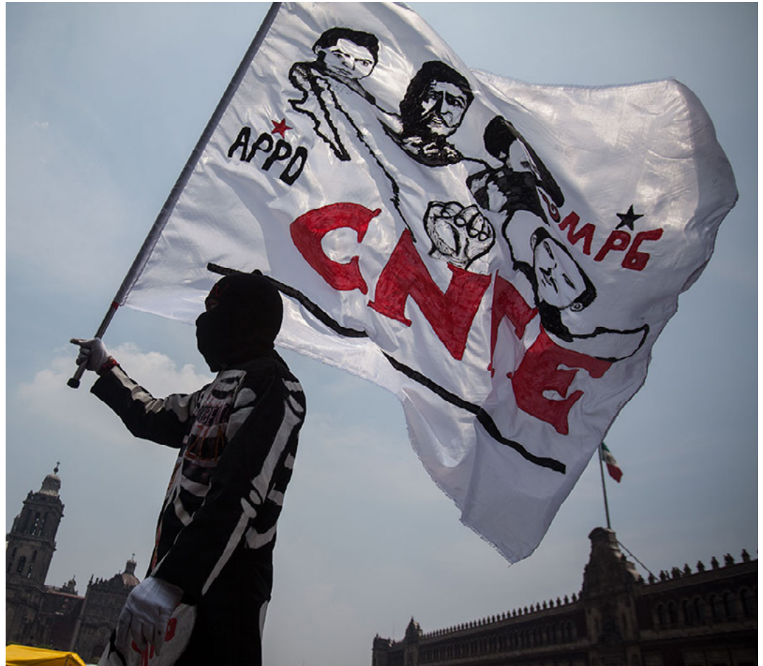
Sindicalistas mexicanos del sector educativo manifestandose.

nos alcanzó el futuro y, en pleno siglo XXI, vemos con vergüenza que el Estado no ha sido capaz siquiera de cumplir con el mandato del adelantado Artículo 3º. de la Constitución de 1917. Para colmo, el gobierno vigente está empeñado en retroceder (y no a la Constitución de 1857, por cierto, sino a los peores ejemplos latinoamericanos). Telúrico y combativo ni Vasconcelos, siendo como era, pudo influir en las decisiones dictatoriales de Álvaro Obregón, uno de los artífices del vigente vicio de mandar “por sus reales...”