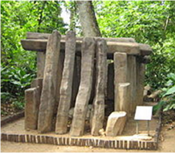
Tumba que contenía dos cuerpos humanos, Edificio A2. Actualmente en el Parque Museo La Venta.

partir del tamaño y la diversidad de la ciudad, que la sociedad local consistió en una élite, una clase de artesanos, y un nutrido grupo de trabajadores y agricultores que mantenían a las demás clases.