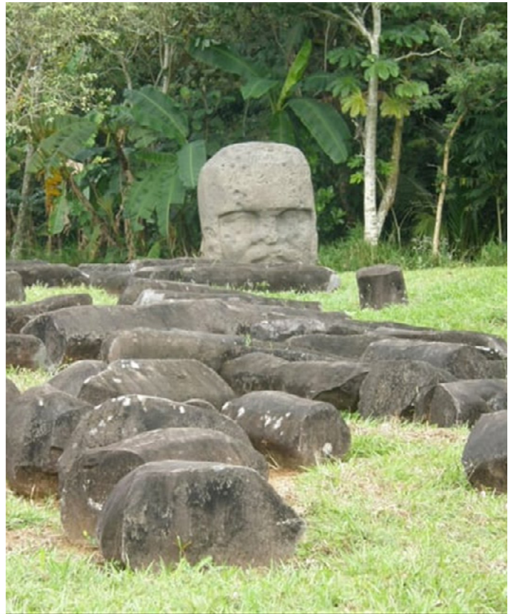
Restos de construcciones en el complejo "A".

El Altar 5 se encontró frente al Altar 4 y es parecido en apariencia y tamaño, cuenta con un alto de 1.58 m, un ancho de 2.08 m, un grosor de 1.86 m y un peso de 16.87 toneladas. 27 En este altar, la figura central sostiene en su mano un bebé inerte conocido como hombre-Jaguar. El lado izquierdo del Altar 5 tiene cinco bajorrelieves de los míticos hombres-jaguar.