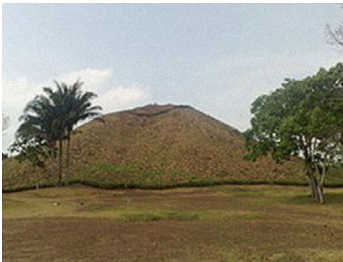
Pirámide principal en La Venta.