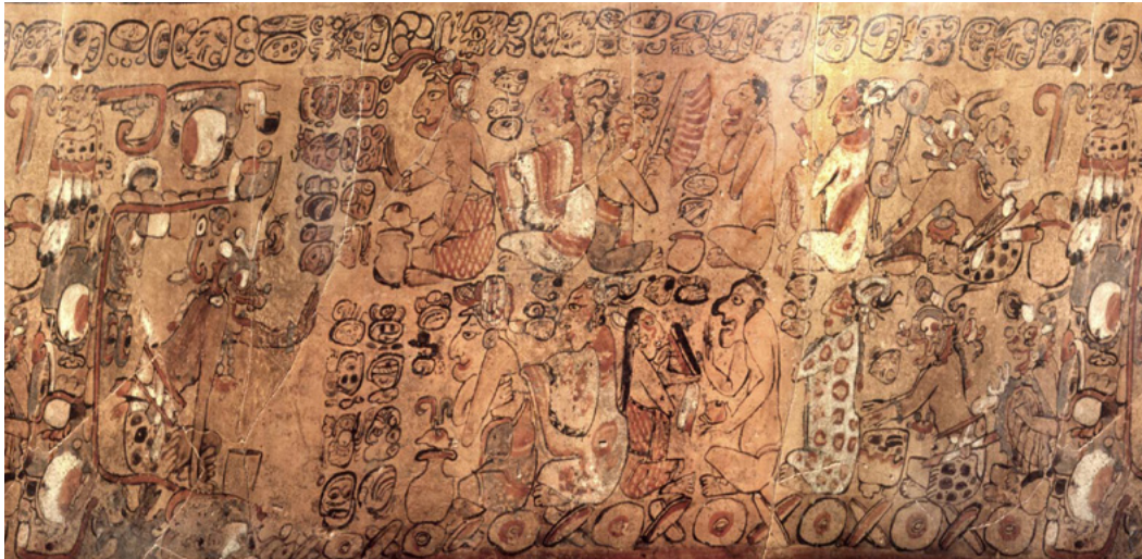
Cuatro dioses ancianos se preparan para una ceremonia a Itzamná Justin Kerr K530 http://research.mayavase.com/kerrmaya.html