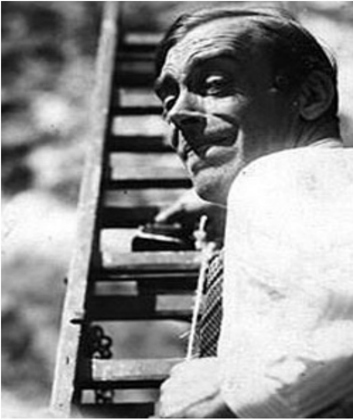
Walter Ruttmann.

alguna forma vinculan a las situaciones diarias con esta máquina. Considerando el año en que se grabó esta cinta no sería extraño pensar en el posible uso político y propagandístico que debieron darle, se puede entender aquí, la imagen del ferrocarril como un transportador de avance económico, político y social, pues también se le ve a los distintos soldados alemanes a inmediatez del medio de transporte.