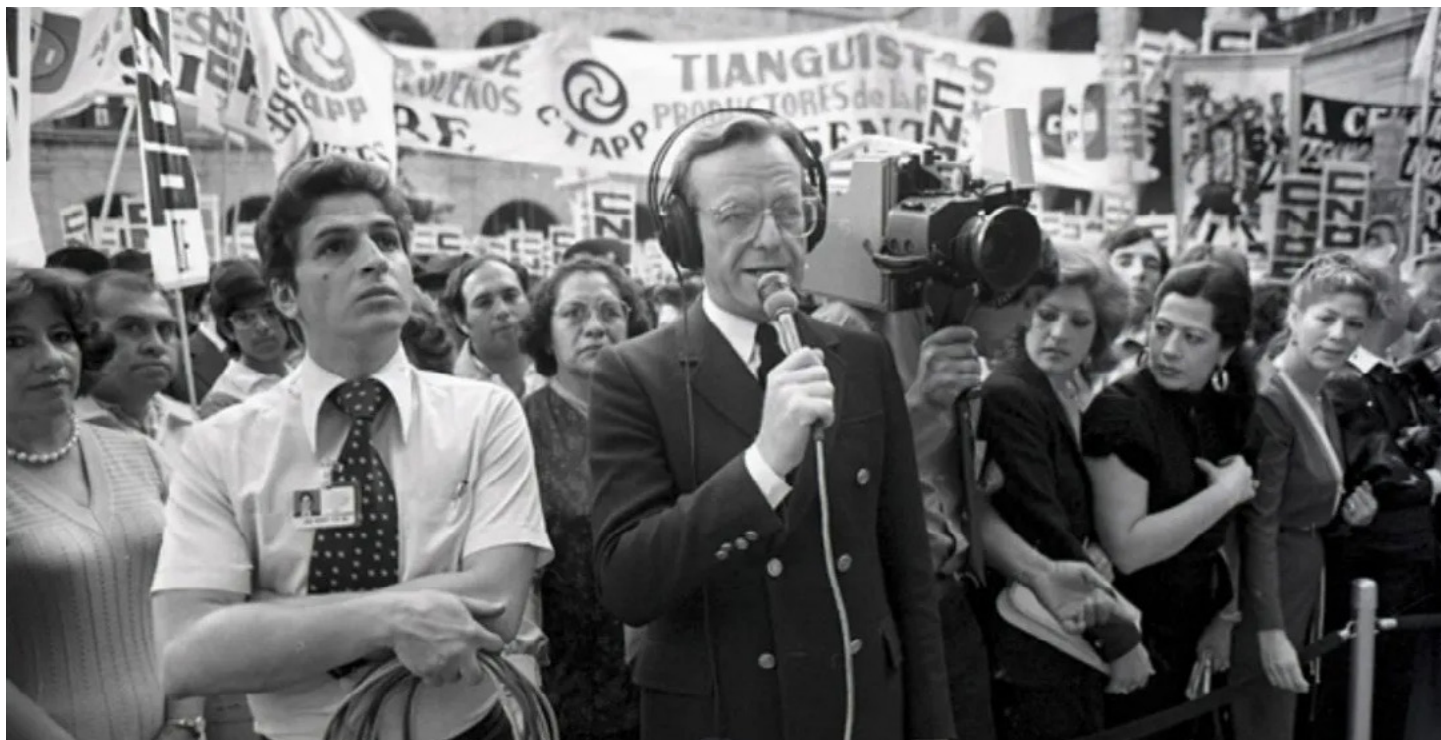
Jacob Zabłudovski.