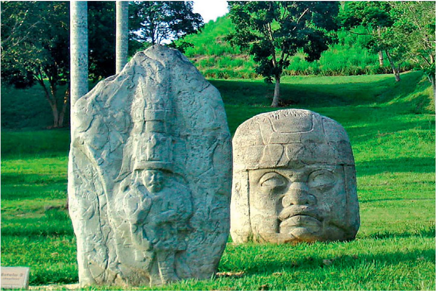
Zona Arqueológica La Venta.