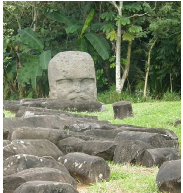
Restos de construcciones en el complejo "A".

Al norte del Conjunto A estaba el llamado Patio Norte, delimitado por una cerca de columnas de basalto que terminaban entre dos plataformas. Dentro de este patio se encontraban tres plataformas. La construcción tuvo cuatro etapas: