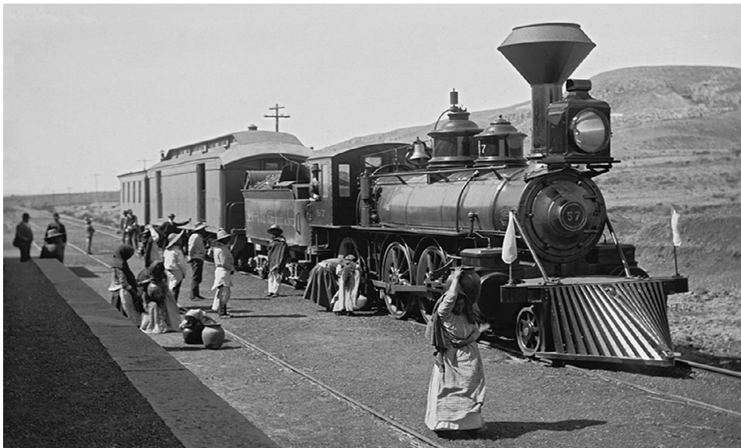
México 1880 (Mexican Central Railway train ).