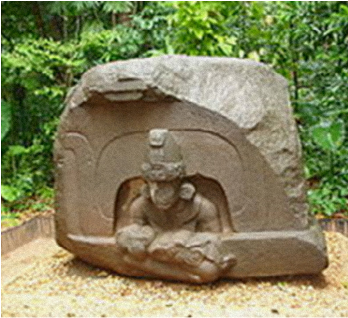
Altar 5. Actualmente en el Parque Museo La Venta.

un periodo anterior. Las cabezas colosales pesan varias toneladas. Su tamaño causa especulación acerca de como los olmecas las movieron. La mina principal del basalto se encuentra en el cerro Cintepec en las montañas de Los Tuxtlas, Veracruz, a 80 km del lugar.