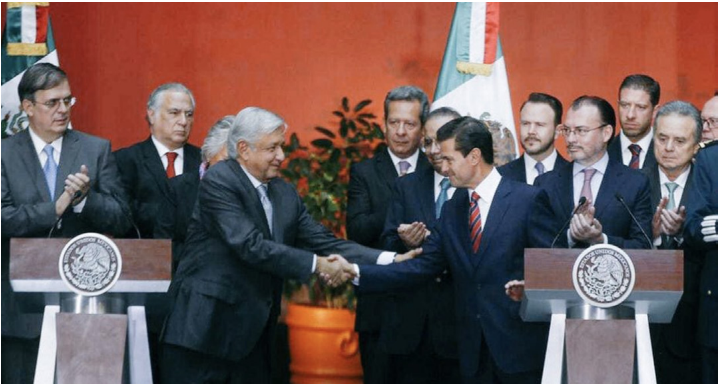
Tlataonismo , mismos privilegios.

que se trafique con personas y órganos de manera impune. No es extraño que, sistemáticamente, se destruyan áreas naturales y se contaminen bosques, ríos, mares y espacios abiertos y cerrados.