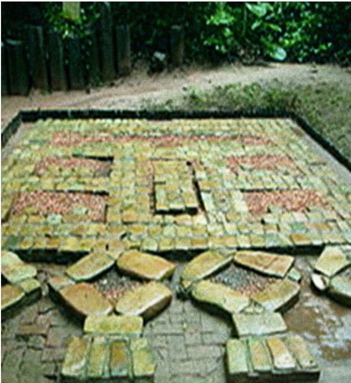
Mosaico del dios jaguar que se encontraba enterrado. Actualmente se localiza en el Museo de Antropología Carlos Pellicer Cámara en Villahermosa.

ancho de 1.66 m, un grosor de 1.76 m, y tiene un peso de 12.42 toneladas. Está elaborado en basalto, y tiene al centro labrada en altorrelieve una figura humana sedente, con las piernas flexionadas una hacia el frente y la otra hacia atrás emergiendo de un nicho. En el lado izquierdo del altar, se observa en bajorrelieve otra figura humana de pie, mientras que en el costado derecho se observan dos figuras humanas también en bajorrelieve en posición sedente en actitud de diálogo.