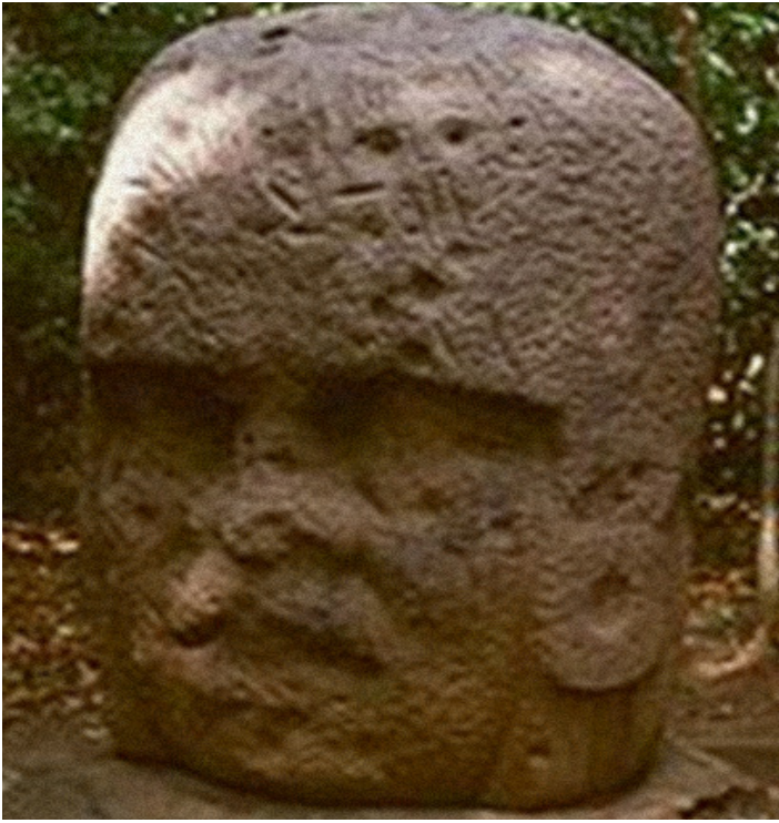
Monumento 3. Actualmente en el Parque Museo La Venta.