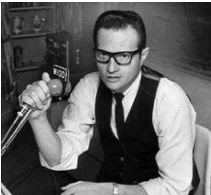
Larry King.

La muerte de Larry King, el sábado pasado, lleva a reflexionar en torno a esa profesión de reflectores y micrófonos. Su programa en la cadena CNN, “Larry King Live”, le permitió entrevistar materialmente a todos los dirigentes del mundo, los actores, la gente con algo que decir. Intrigante a ratos, simpático, claridoso, Larry King permitió durante medio siglo el acercamiento (approachment) del público general con los hombres del poder y el espectáculo.