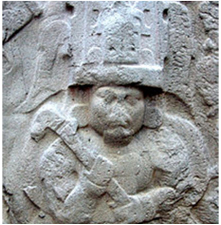
Rey o jefe de La Venta.

La estructura más importante de La Venta es una pirámide construida con barro acumulado. Su planta es irregularmente circular, tiene un diámetro de 128 m y una altura de 31.4 m, no tiene plataforma en la cumbre, ni escalera, ni rampa. La superficie exterior tiene diez entrantes y diez salientes, y le dan a la estructura la forma de un molde de redondeado. La cantidad de barro que se empleó en su construcción es calculada en 100 mil m 3 , y es la pirámide más antigua de Mesoamérica. Uno de los “altares” de basalto más sobresaliente es el