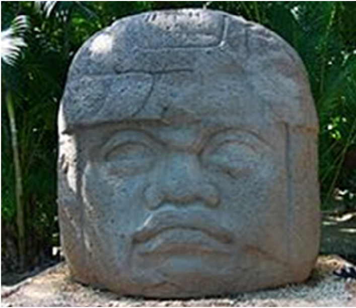
Monumento 1. Parque Museo La Venta.

En el centro de la isla, los edificios forman una plaza en forma de rectángulo irregular, con una pirámide principal de 34 m de altura, 140 m de diámetro y su masa está calculada en 99,000 m 3 , siendo la pirámide más antigua de Mesoamérica, localizada en el centro, montículos y monumentos en el norte y en el sur. Su arquitectura monumental de tierra, su trazo planificado, su numeroso acervo escultórico de piedra y sus ofrendas de jade, han hecho que esta zona arqueológica tenga importancia aún en nuestros días.