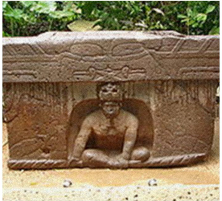
Altar 4. Actualmente en el Parque Museo La Venta.

Aunque las tres esculturas representan cabezas humanas, no son iguales, ya que presentan diferencias en tamaño, rasgos faciales e indumentaria. Las tres cabezas portan “cascos”, sin embargo solo en los Monumentos 2 y 4 es posible leer las insignias. La más identificable es la del Monumento 4 que al parecer es una garra con tres dedos. Las tres cabezas portan orejeras de diferente forma y tamaño. Aunque las tres cabezas fueron esculpidas en basalto, al parecer solo el Monumento 4 parece haber tenido un recubrimiento. 22 Uno de los rasgos más característicos de estas tres esculturas, es que los labios están entreabiertos, pudiendo observarse los dientes frontales, como si hubieran sido esculpidos en el momento que hablaban, captando la actitud natural del momento.